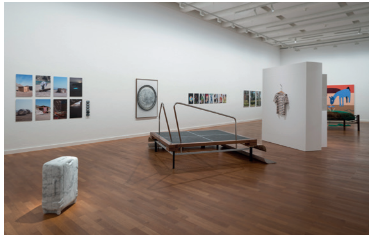
Blick in die ERNTE 22

Mi 23.10. | 12.30 Uhr Eine Frage der Haltung Sa 16.11. | 15 Uhr Wildsau! Theater im Museum